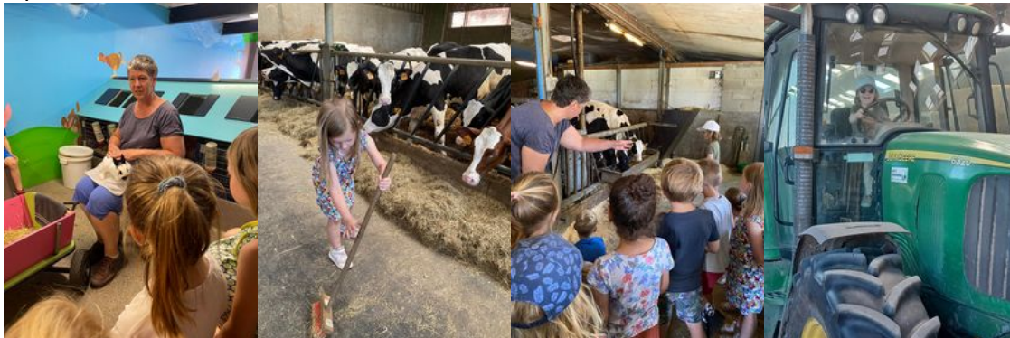
Uitstap naar het Broekxhof in Peer! We mochten kleine dieren zoals kittens, cavia's, konijnen en hamsters knuffelen. Daarna kregen we ook nog een verdere, actieve rondleiding in deze boerderij met koeien, paarden en geiten. Namiddag trokken we naar een speeltuin.