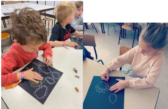
Op bezoek in de muziek- en kunstacademie van Hasselt.