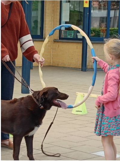
Fijne vakantie allemaal!