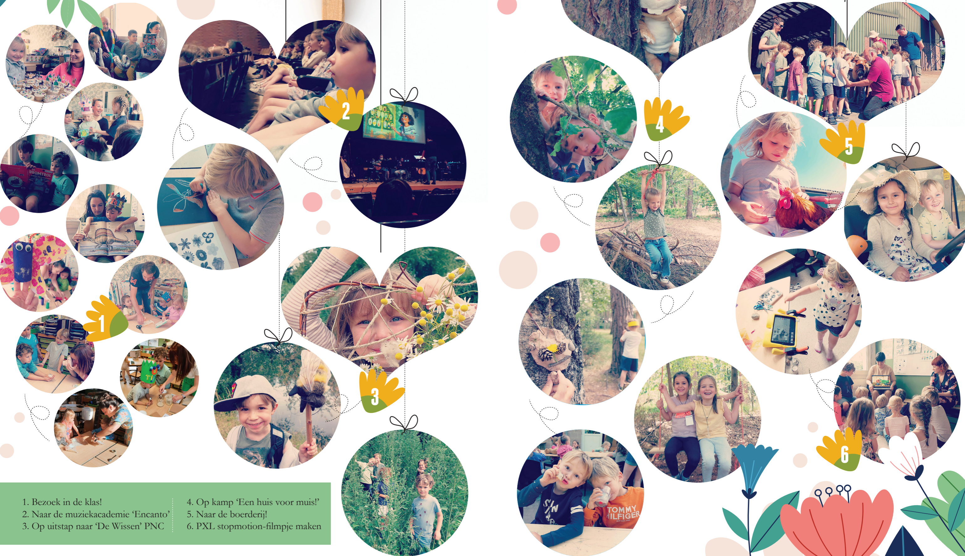
1. Bezoek in de klas!