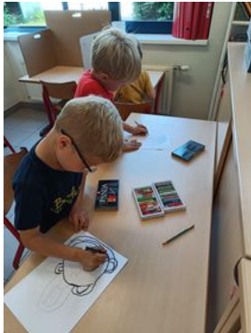
Proberen en oefenen in het eerste leerjaar.