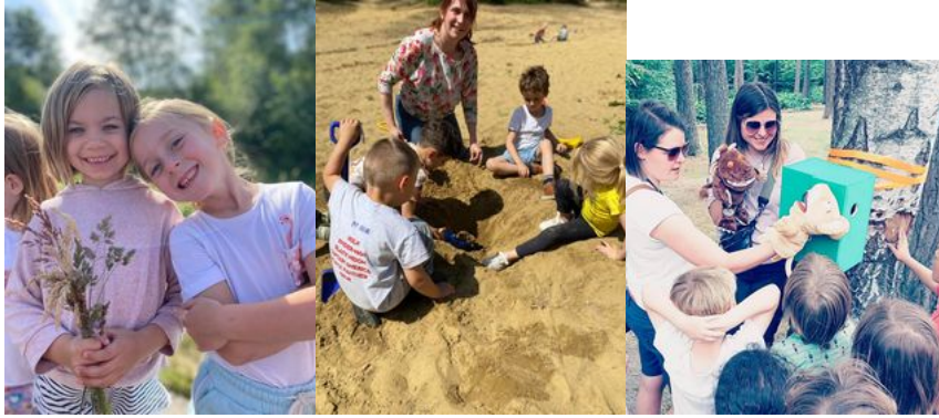
Op kamp met Gruffalo en Muis.